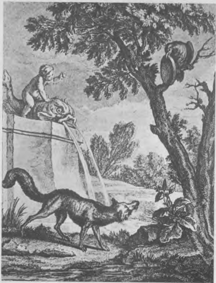
Le Corbeau et le Renard, par Oudry