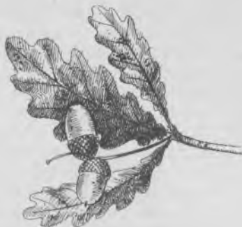
les feuilles et les fruits d'un chêne