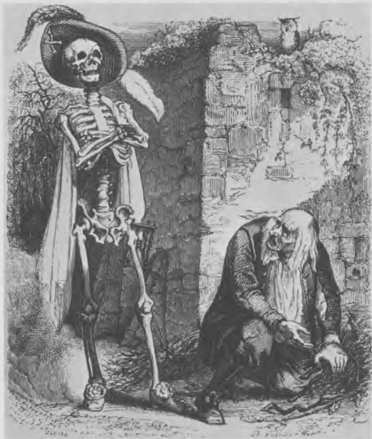
La Mort et le Bûcheron, par Grandville