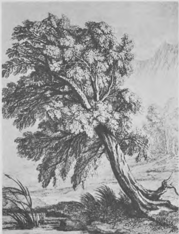
Le Chêne et le Roseau, par Oudry