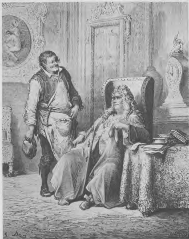
Le Savetier et le Financier, par Doré