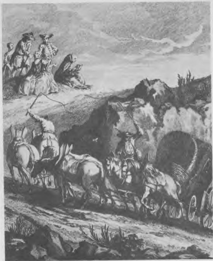
Le Coche et la Mouche, par Oudry