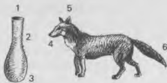
1 l'embouchure 4 le museau 2 le col 5 l'oreille 3 le vase 6 la queue

a fait – 5 le brouet : le bouillon – 5 chichement : la façon de dépenser très peu d'argent – 7 la miette : petite partie qui tombe du pain quand on le coupe – 8 laper : manger avec la langue – 8 le tout : c'est-à-dire les deux assiettes – 10 prier : inviter – 16 cuit à point : bien cuit, bien préparé – 19 menu : petit – 19 friand : délicat – 20 embarrasser : rendre perplexe, gêner – 23 sire : seigneur ( expression ironique ) – 24 à jeun : sans avoir mangé.