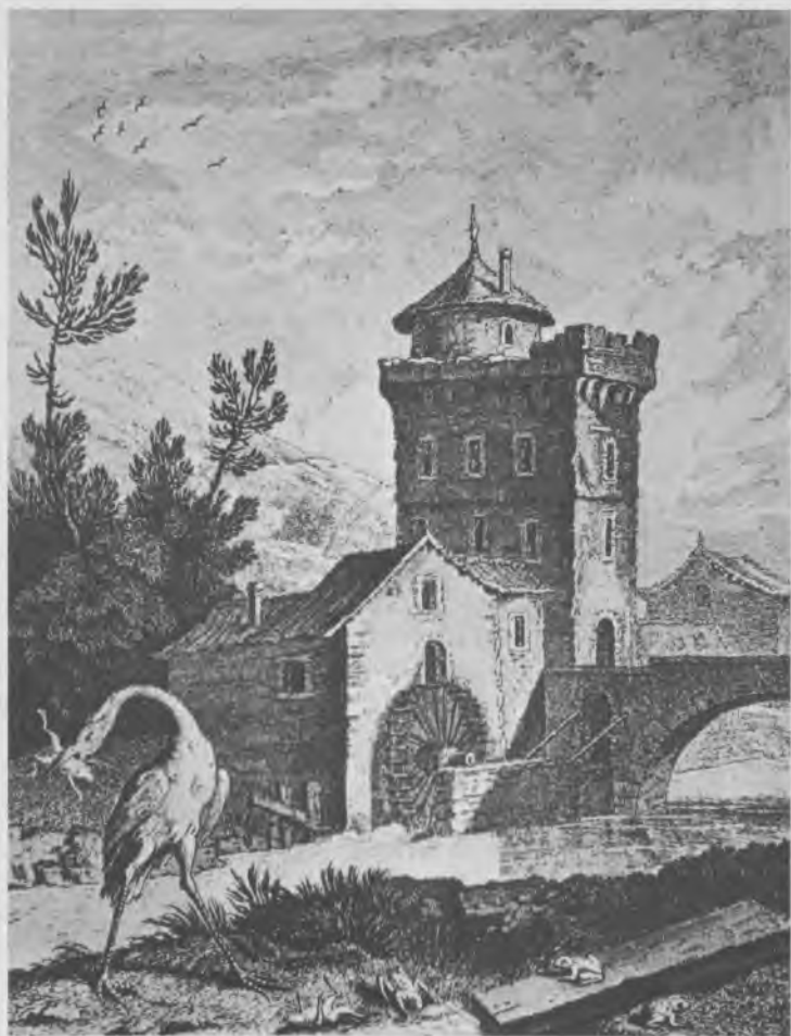
Les Grenouilles qui demandent un Roi, par Oudry