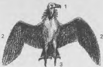
1 le bec 2 les ailes 3 la serre