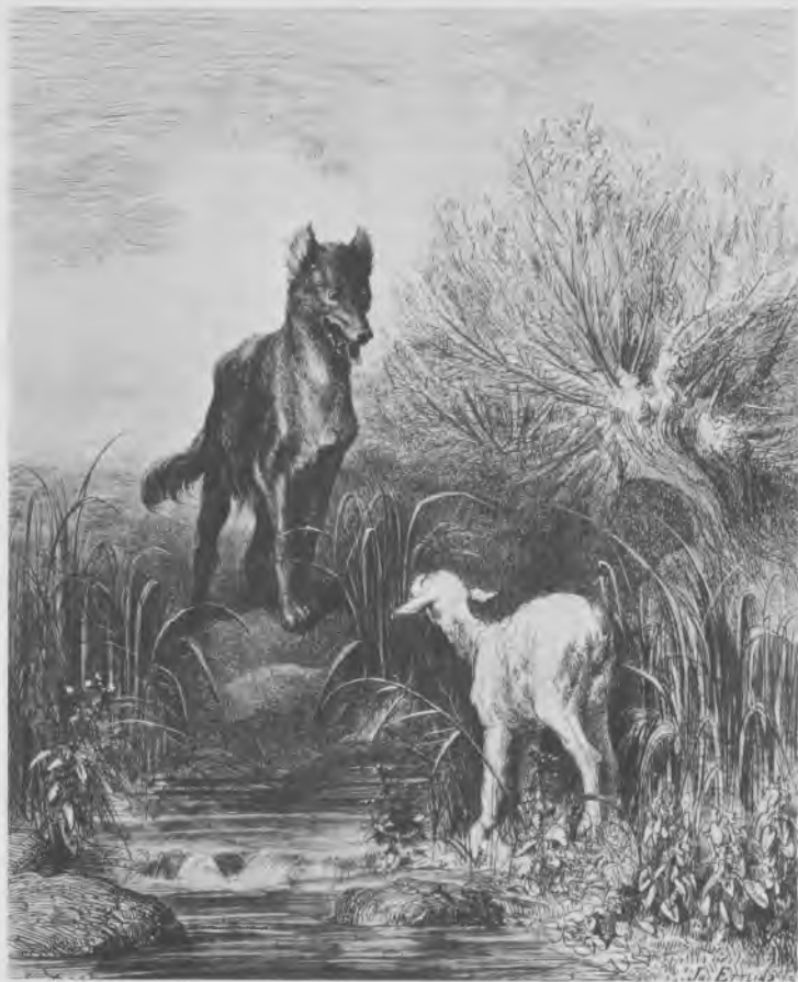
Le Loup et l'Agneau, par Doré