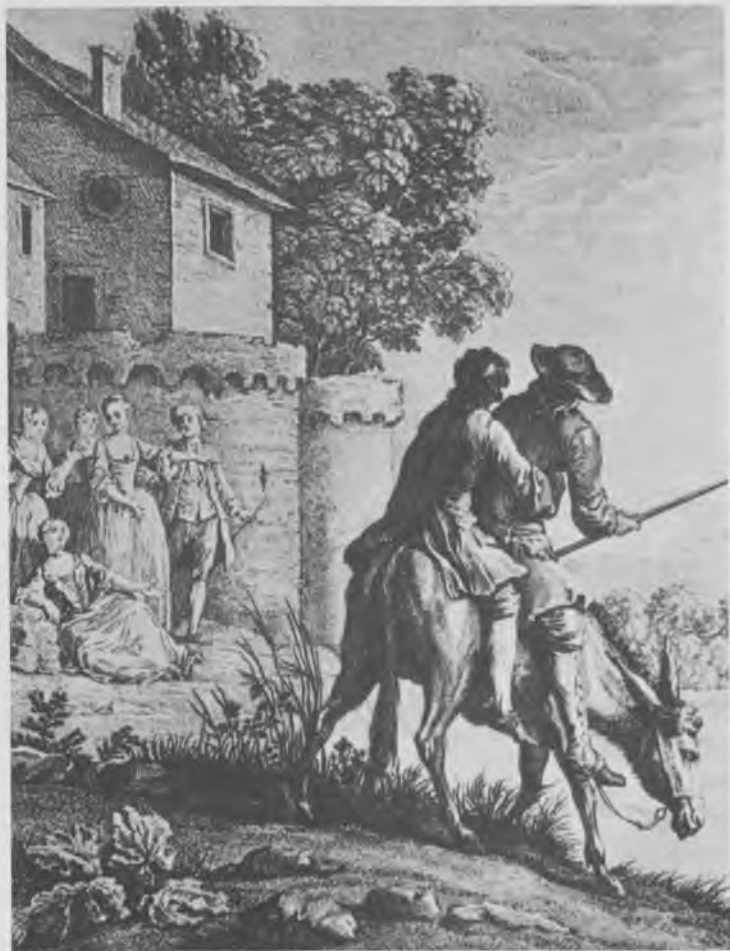
Le Meunier, son Fils et l'Âne, par Oudry