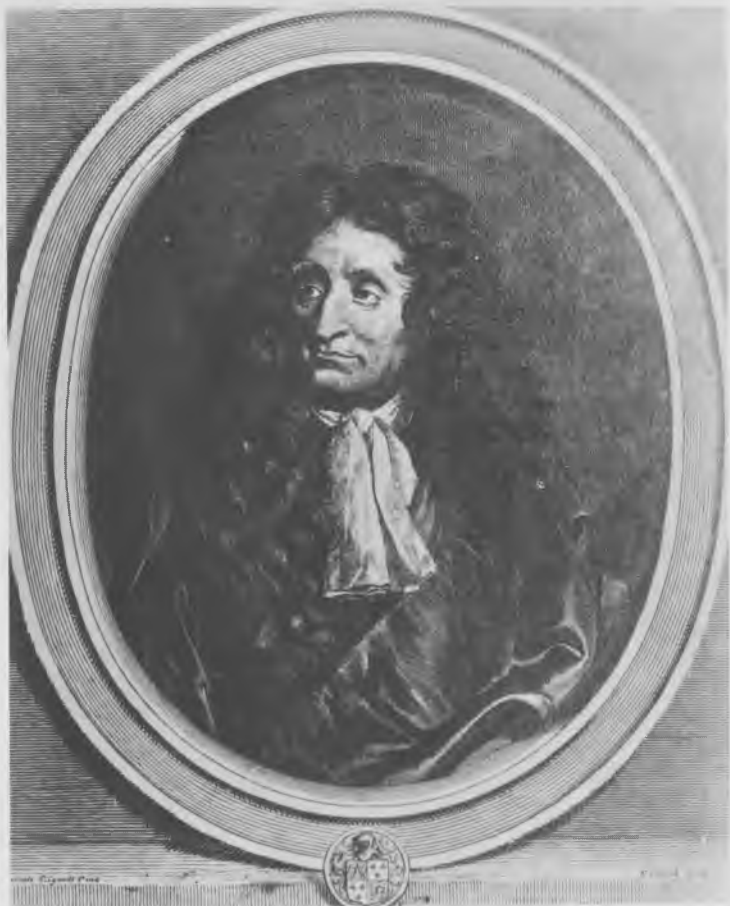
Jean de La Fontaine