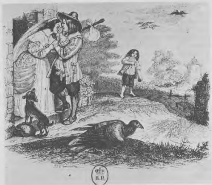
Les deux Pigeons, par Grandville